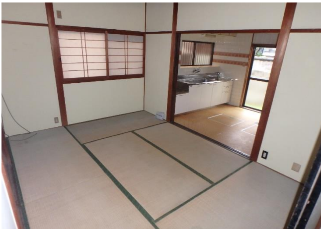
( 和 室 )