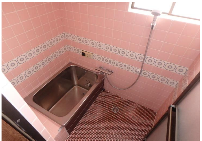
( お風呂 )