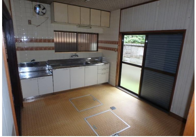
( ダイニングキッチン )