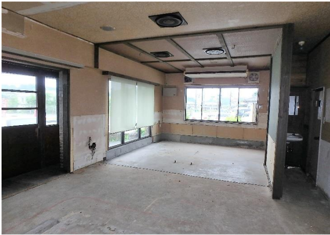
( 店舗スペース )