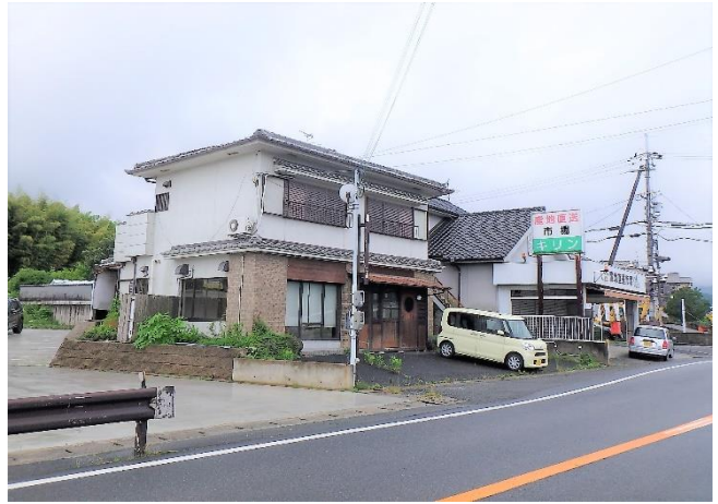
( 外 観 )