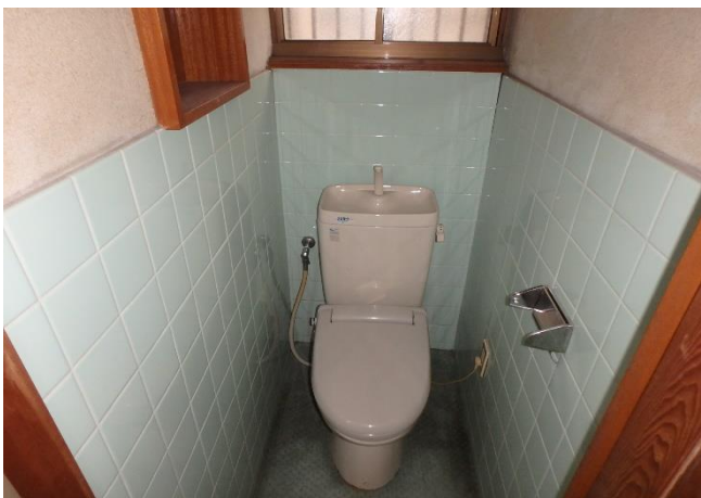
( トイレ )